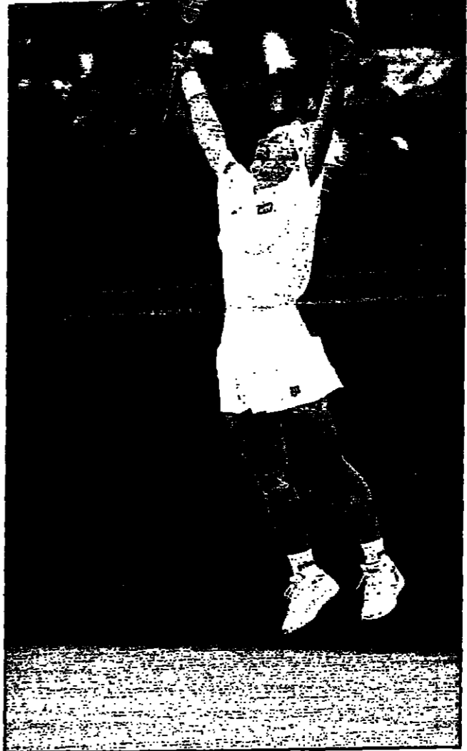
التشيكية جانا نوفوتنا

■ لندن-رويترز: سمحت التشيكية يانا نوفوتنا الى الدور قبل النهائي في بطولة ويمبلدون للتنس امس الاربعاء وتغلبت نوفوتنا المصنفة الثالثة في البطولة على الاندونيسية يايوك ياسوكي 6/3 و 6/4 في جوار المشايخ.